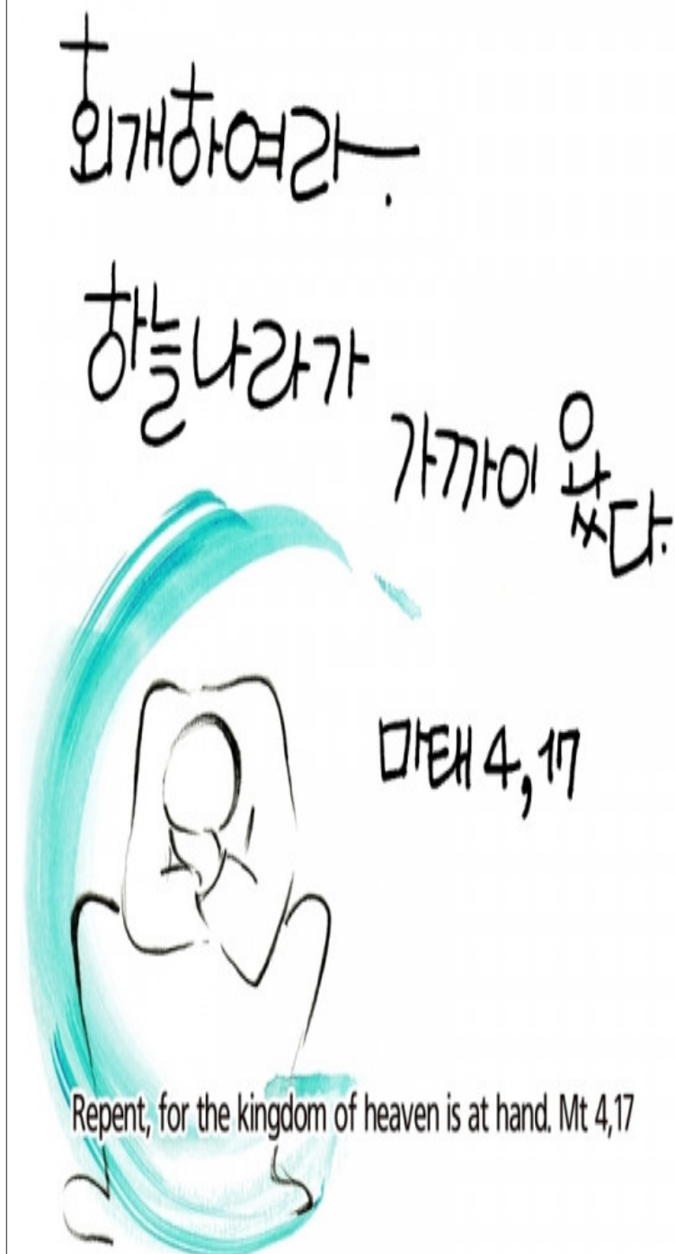
Repent, for the kingdom of heaven is at hand. Mt 4,17

* 복음 마태오3,1-12 그 무렵 세례자 요한이 나타나 유다 광야에서 이렇게 선포하였다. “회개하여라. 하늘 나라가 가까이 왔다.” 요한은 이사야 예언자가 말한 바로 그 사람이다. 이사야는 이렇게 말하였다. “광야에서 외치는 이의 소리. ‘너희는 주님의 길을 마련하여라. 그분의 길을 곧게 내어라.’” 요한은 낙타 털로 된 옷을 입고 허리에 가죽 띠를 둘렀다. 그의 음식은 메뚜기와 들꿀이었다. 그때에 예루살렘과 온 유다와 요르단 부근 지방의 모든 사람이 그에게 나아가, 자기 죄를 고백하며 요르단 강에서 그에게 세례를 받았다. 그러나 요한은 많은 바리사이와 사두가이가 자기에게 세례를 받으러 오는 것을 보고, 그들에게 말하였다. “독사의 자식들이야, 다가오는 진노를 피하라고 누가 너희에게 알려 주더냐? 회개에 합당한 열매를 맺어라. 그리고 ‘우리는 아브라함을 조상으로 모시고 있다.’고 말할 생각일랑 하지 마라. 내가 너희에게 말하는데, 하느님께서서는 이 돌들로도 아브라함의 자녀들을 만드실 수 있다. 도끼가 이미 나무뿌리에 닿아 있다. 좋은 열매를 맺지 않는 나무는 모두 찍혀서 불 속에 던져진다. 나는 너희를 회개시키려고 물로 세례를 준다. 그러나 내 뒤에 오시는 분은 나보다 더 큰 능력을 지니신 분이시다. 나는 그분의 신발을 들고 다닐 자격조차 없다. 그분께서는 너희에게 성령과 불로 세례를 주실 것이다. 또 손에 킌을 드시고 당신의 타작마당을 깨끗이 하시어, 알곡은 곳간에 모아들이시고 쭉정이는 꺼지지 않는 불에 태워 버릴 것이다.” 주님의 말씀입니다. © 그리스도님, 찬미합니다.