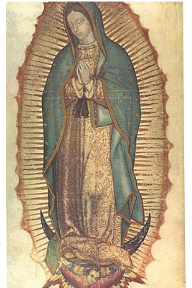
[ 과달루페의 성모 ]

★ 성경공부 저녁반 모집 일시/장소: 10월 6일(월) 부터 매주 월요일 저녁 7시 / 성당 친교실 강사: 유병기 베네딕도 문의: 최안토니아(732-609-5961), 김엘리사벳(732-325-8742)