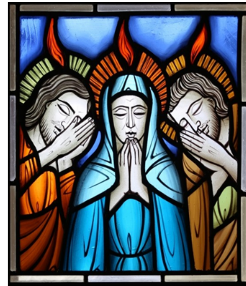
〈풍수원 성당 유리화〉