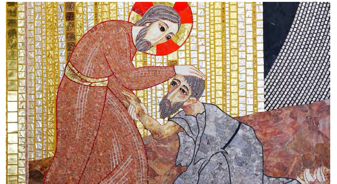
그는 나병이 가시고 깨끗하게 되었다. <마르코 1,42>