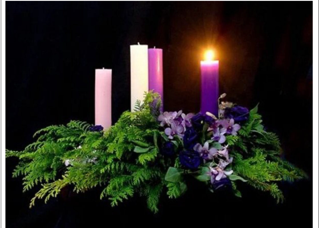
집주인이 언제 돌아올지 모르니 깨어 있어라. <마르코 13,33-37>