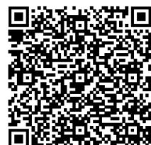
리빙 윌 (Living Will) 한글/영문 서류