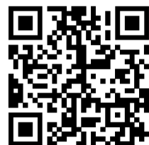
자세한 정보 washingtonlawhelp

당신의 의료 제공자, 당신의 대리인, 당신이 신뢰하는 친구 또는 친척에게 지시서를 주어야 합니다. 당신은 또한 당신의 병원이 당신을 위하여 서류철에 이 양식을 보관할 것인지를 지역 병원에 물어보아야 합니다.