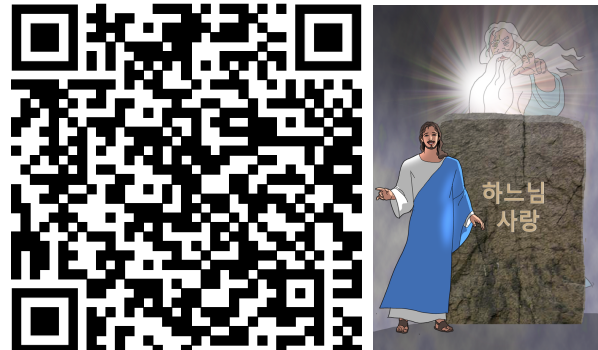
SCAN ME: 가스펠톤

그때에 예수님께서 사두가이들의 말문을 막아 버리셨다는 소식을 듣고 바리사이들이 한데 모였다. 그들 가운데 율법 교사 한 사람이 예수님을 시험하려고 물었다. “스승님, 율법에서 가장 큰 계명은 무엇입니까?” 예수님께서 그에게 말씀하셨다. “네 마음을 다하고 네 목숨을 다하고 네 정신을 다하여 주 너의 하느님을 사랑해야 한다.’ 이것이 가장 크고 첫째가는 계명이다. 둘째도 이와 같다. ‘네 이웃을 너 자신처럼 사랑해야 한다.’는 것이다. 온 율법과 예언서의 정신이 이 두 계명에 달려 있다.” 주님의 말씀입니다. © 그리스도님, 찬미합니다.