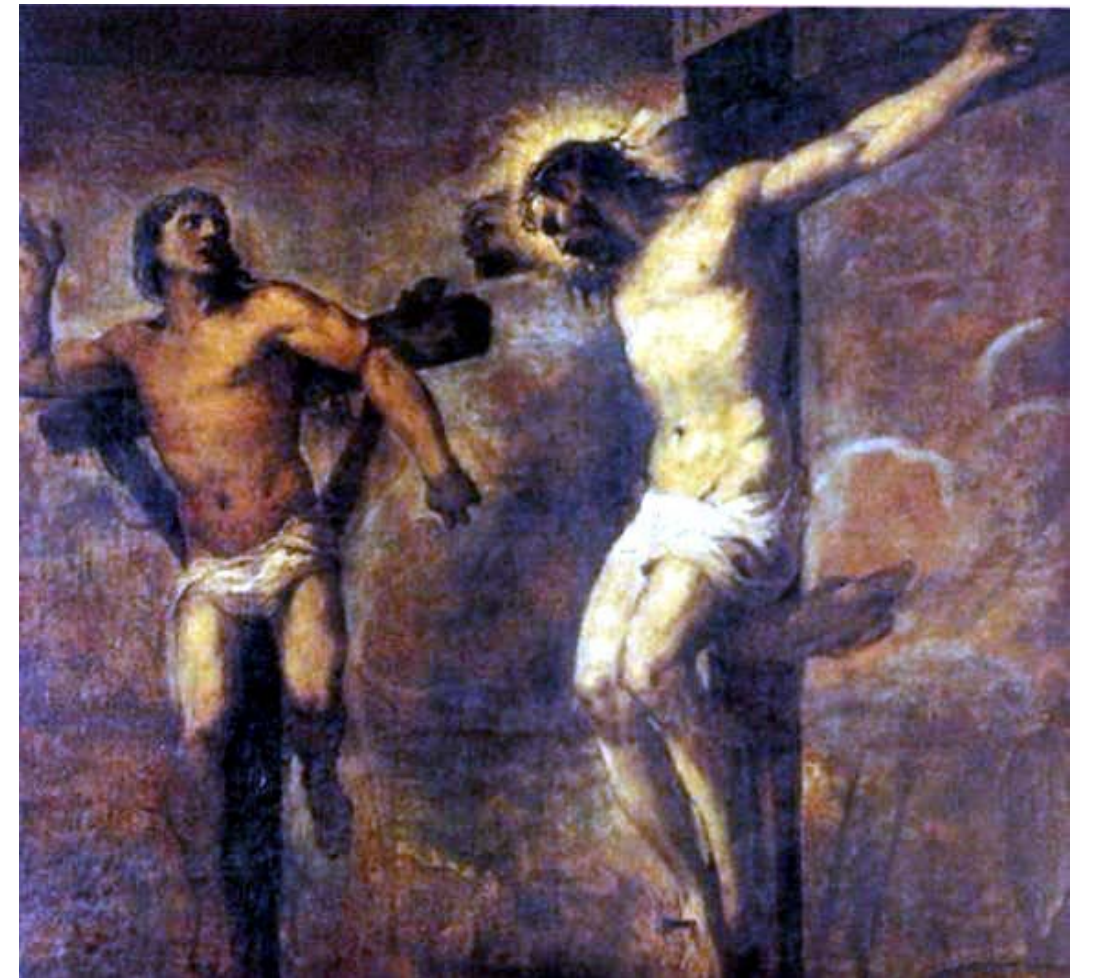
주님, 주님의 나라에 들어가실 때 저를 기억해 주십시오. <루카20,42>