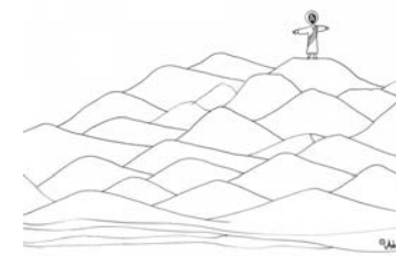
“나는 하늘과 땅의 모든 권한을 받았다.” 마태 28,18

그때에 열한 제자는 갈릴래아로 떠나 예수님께서 분부하신 산으로 갔다. 그들은 예수님을 뵈고 엎드려 경배하였다. 그러나 더러는 의심하였다. 예수님께서서는 그들에게 다가가 이르셨다. “나는 하늘과 땅의 모든 권한을 받았다. 그러므로 너희는 가서 모든 민족들을 제자로 삼아, 아버지와 아들과 성령의 이름으로 세례를 주고, 내가 너희에게 명령한 모든 것을 가르쳐 지키게 하여라. 보라, 내가 세상 끝 날까지 언제나 너희와 함께 있겠다.” 주님의 말씀입니다. © 그리스도님 찬미합니다.