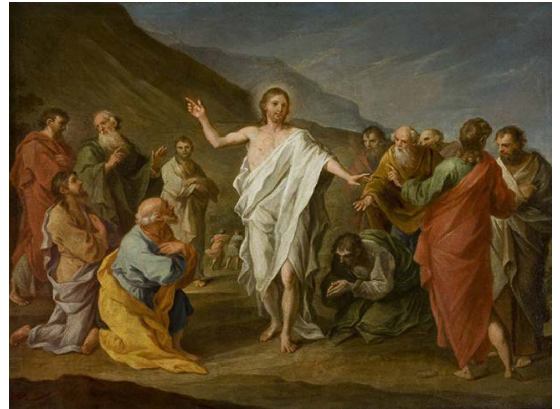
〈그리스도의 부활〉 시몬 체허비츠, 폴란드 시립 미술관 1758