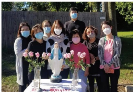
▲ 코로나 해 10월, 선서식을 위한 주차장 반짝 주회

- 영어모임 : 매월 둘째, 넷째 금요일 오전 11시30분, 친교실 - 한국말 모임: 신설예정