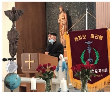
▲ 아치에스 행사