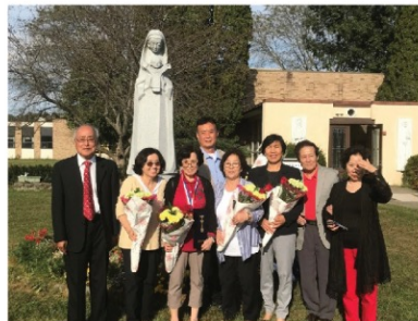
▲ 레지오 단원 교육 참가