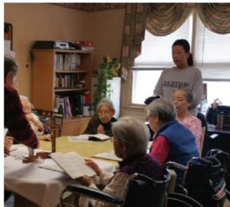
▲ 요양원 어르신들과 함께