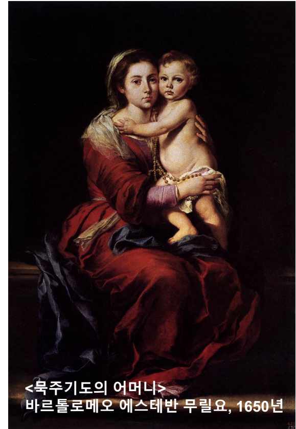
<복주기도의 어머니> 바르톨로메오 에스테반 무릴요, 1650년