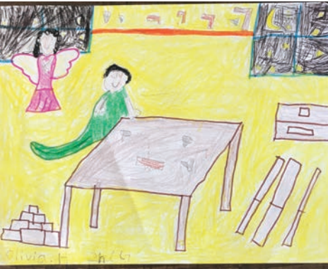
첫 영성체반 올리비아 한