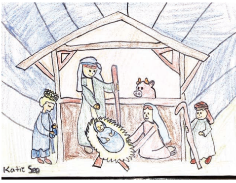
5학년 케이티 서