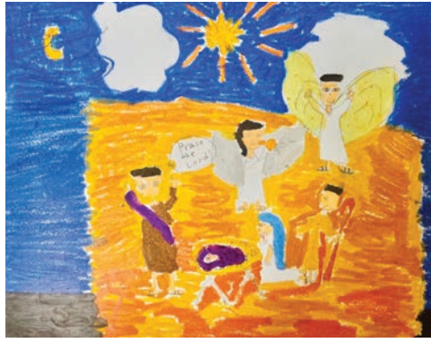
첫 영성체반 나제이