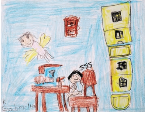
유치부 가브리엘 한