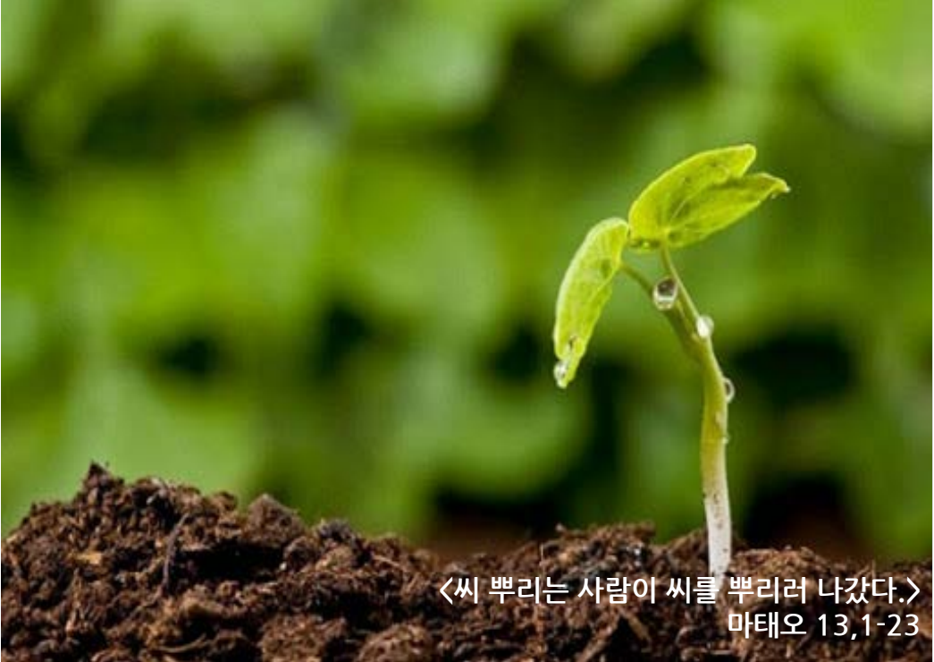
<씨 뿌리는 사람이 씨를 뿌리러 나갔다.> 마태오 13,1-23