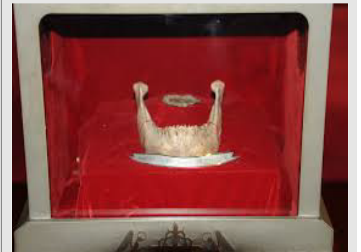
성 김대건 신부님 아래턱뼈 - 미리내 성지 성 요셉 성당 안치

오늘날 우리는 여러 성지와 성당에서 성인들의 유해를 많이 접하고 또 그 앞에서 마음을 다해 그 성인께 전구를 청하기도 합니다. 다만 성인들의 유해공경이 가끔 '기복적 신앙'으로 변하는 것을 조심해야 할 것입니다. 성인 유해 앞에서 기도하면 우리가 바라는 것을 이루어주시리라는 마음이 그것입니다. 성인들의 뼈와 살점이 우리를 하느님을 사랑하고 이웃을 사랑하는 삶으로 이끄는 데 좋은 도구가 되도록 우리의 마음과 의지 그리고 모든 생각들도 함께 봉헌 할 수 있기를 바라봅니다. 성령이 함께하시고 그리스도의 몸과 피를 모시는 우리들의 몸 역시 하느님이 머무시는 성전입니다. 우리의 몸과 마음 그리고 그 몸과 마음으로 사는 삶으로 우리도 성인이 되려는 노력을 이 순교자 성월에 더욱 열심히 해 나가는 시간이 되시길 바랍니다.