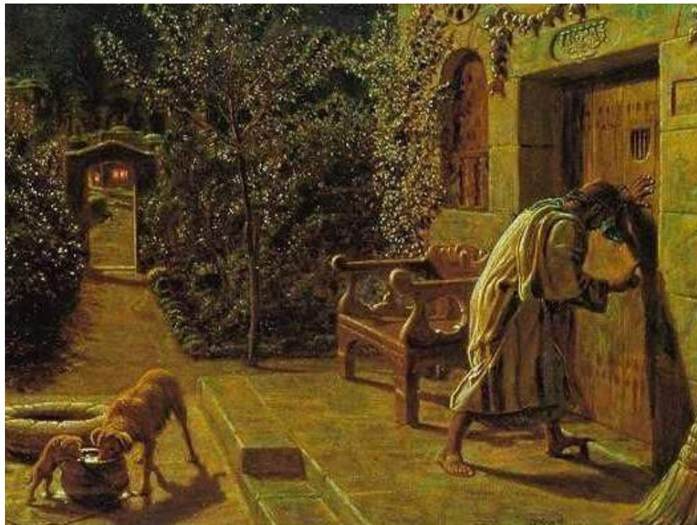
청하여라, 너희에게 주실 것이다. Ask and you will receive.