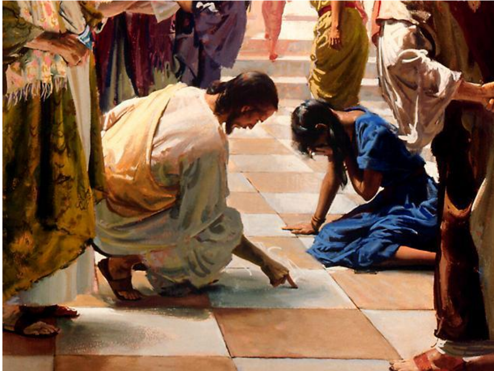
너희 가운데 죄 없는 자가 먼저 저 여자에게 돌을 던져라. Let the one among you who is without sin be the first to throw a stone at her.